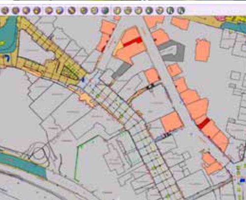
Bestandsaufnahme in der Stadt Gummersbach bedeutet unter anderem auch, die gesamte Möblierung der Fußgängerzone (Bild oben) in Form von GIS-Daten zu dokumentieren (Bildausschnitt rmDATA GeoDesktop unten).